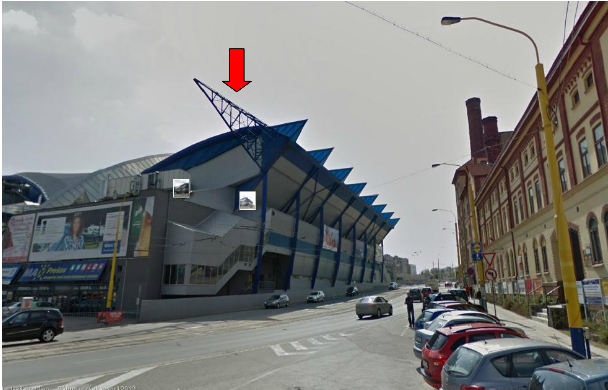
Obr. 3 Navrhované umiestnenie kamery č. 2 - budova Steel arény