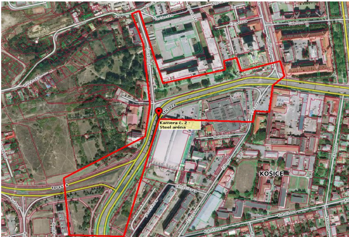
Obr. 4 Zóna monitorovania kamery č. 2