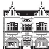
A 22 - Alžbetina 22