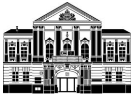
H 27 - Hlavná 27