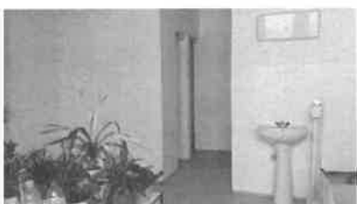
m.č. 246, 247, 248, 240