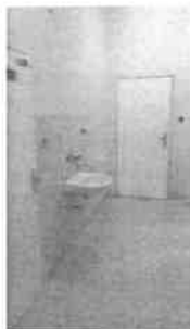
m.č. 239,240 servisný priestor