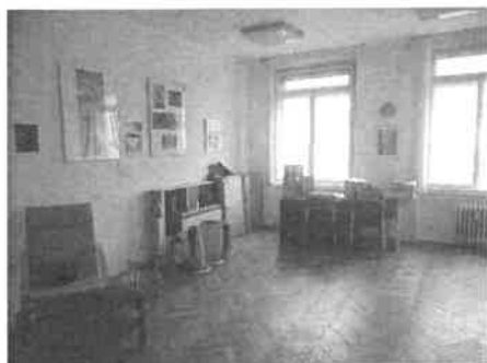
m. č. 204

obhliadky: Zuzana SPIŠÁKOVÁ tel. č. 915 697585