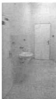
m.č. 239,240 servisný priestor