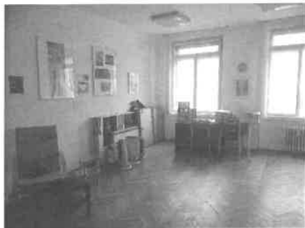
m. č. 204