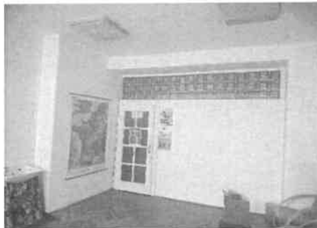
m. č. 204