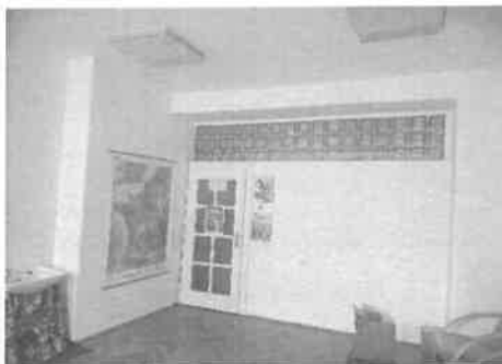
m. č. 204