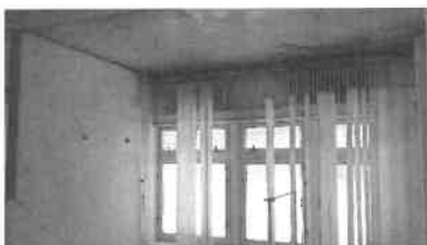
m. č. 179, 180