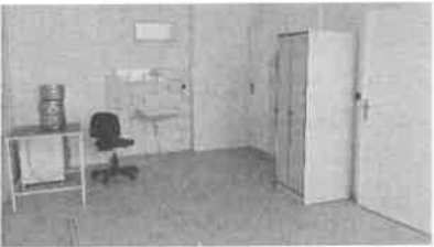
m.č. 246, 247, 248, 240