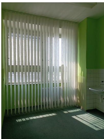
m. č. 145