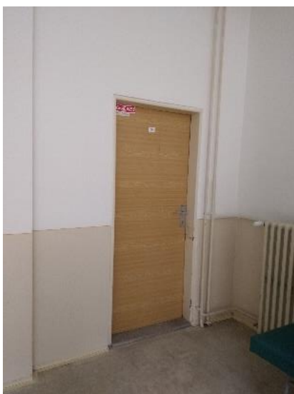
sklad, suterén m. č. 044