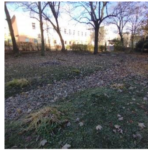
Obrázok 1 – 6 Záhrada pri ZŠ