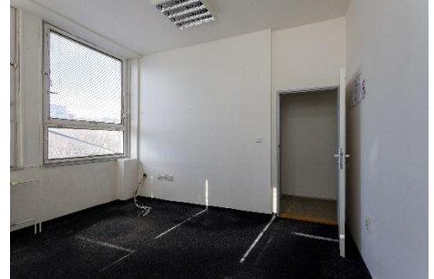
m. č. 362, 364