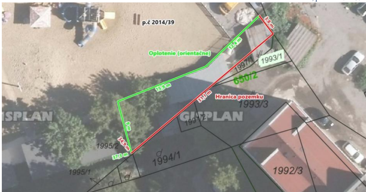
Obrázok 1 Pozemok, parc. č. 2014/39

Ďalej bolo kontrolou zistené, že v Zmluvách o podnájme uzatvorených so spoločnosťami Akzent BigBoard, a. s. a REEST, s. r. o. sú nesprávne určené výšky podnájomného za reklamné zariadenia.