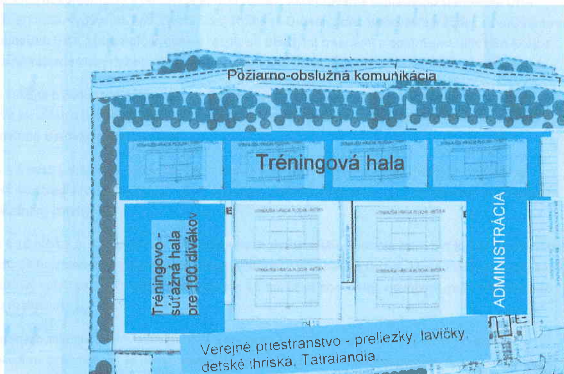
Amatérsky návrh možného usporiadania objektov.

Ako prejav úprimnosti zo strany investora vo vzťahu k budúcemu využitiu stavby ako občania očakávame, že zapracuje do projektu také dispozičné a technické riešenie, ktoré by bolo v praxi nepoužiteľné pre iný, než deklarovaný účel. Takýmto dispozičným riešením by mohol byť spomínaný pôdorysný tvar budovy, nevhodný pre iné aktivity.