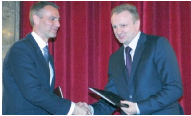
Ričard Raši i Dragan Đilas

GRADONAČELNICI Beograda Dragan Đilas i Košica Ričard Raši potpisali su Memorandum o uzajamnoj podršci kandidaturi Beograda za evropsku prestonicu kulture 2020. godine. Ujedno, gradonačelnici su potpisali i pismo o namerama i jačanju saradnje u oblasti kulture između ova dva grada, kao i razmeni iskustava u oblasti kulture sa Košicama koji će biti evropske prestonice kulture 2013.