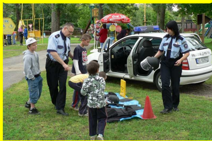
Ukážka výstroja a výbroje