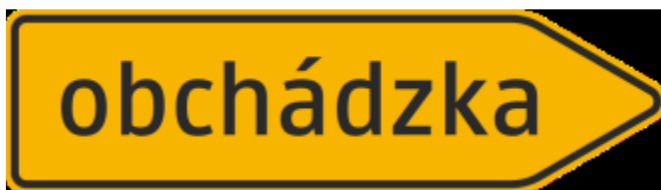
Šípový smerník na vyznačenie obchádzky

Dosť podstatnou zmenou je, že okrem značky, označujúcej obchádzku máme aj ďalšiu, ktorá informuje o konci obchádzky.