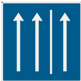
280 Jazda po krajnici

Ide o značku, ktorá umožňuje používať krajinu ako jazdný pruh. Značka je na modrom podklade s tromi bielymi šípkami, pričom krajná vpravo je oddelená plnou, neprerušovanou čiarou. Značka V úseku platnosti značky sa krajnica považuje za súčasť vozovky a značka Pozdĺžna súvislá čiara, ktorá vyznačuje okraj vozovky, má význam značky Pozdĺžna prerušovaná čiara.