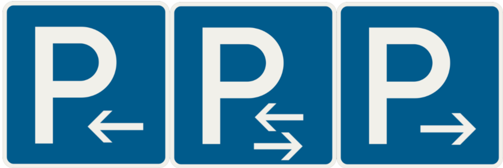
Vyhotovenie značiek vyznačujúce možnosť parkovania.

Rovnako môžu byť označené aj značky „Parkovisko“, ktoré označujú miesto alebo priestor, kde je dovolené zastavenie a státie vozidiel. Ak sa značka použije ako predbežná značka, údaj o polohe alebo o vzdialenosti možno vyznačiť aj v spodnej časti značky. Táto značka však môže byť použitá spolu s dodatočnou tabuľkou s príslušným symbolom vozidla. V takomto prípade označuje miesto alebo priestor, kde je dovolené státie vozidiel len pre určitý druh vozidiel.