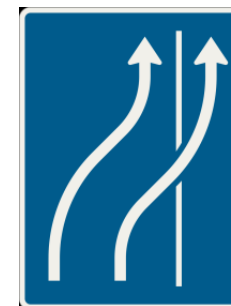
283 Obchádzanie prekážky po krajnici

Dosť podstatnou zmenou je, že okrem značky, označujúcej obchádzku máme aj ďalšiu, ktorá informuje o konci obchádzky.