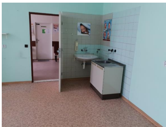
m. č. 321