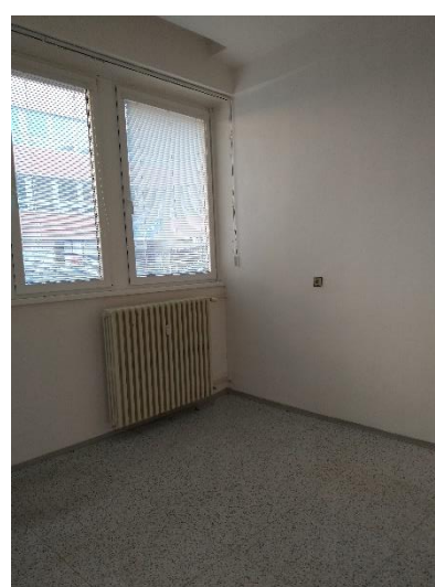
m. č. 014