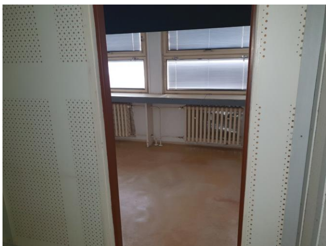
m. č. 322

e) priestor na ul. Americká tr. 17 v Košiciach Zdravotné stredisko Ťahanovce - stav dobrý