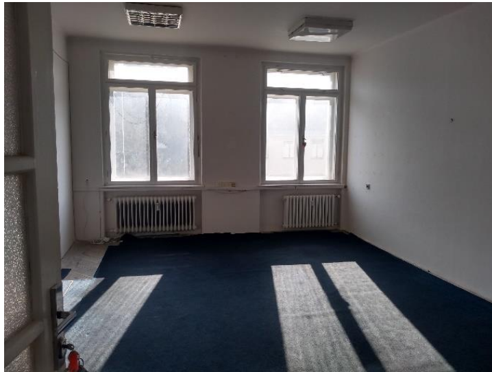
m. č. 320