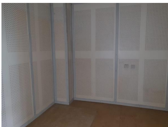
m. č. 321