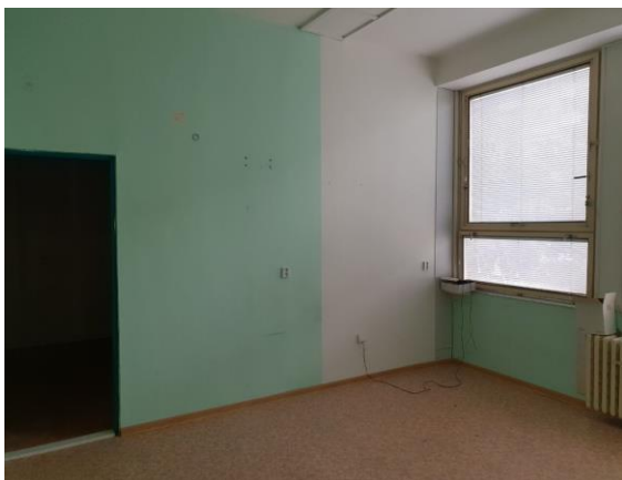
m. č. 320