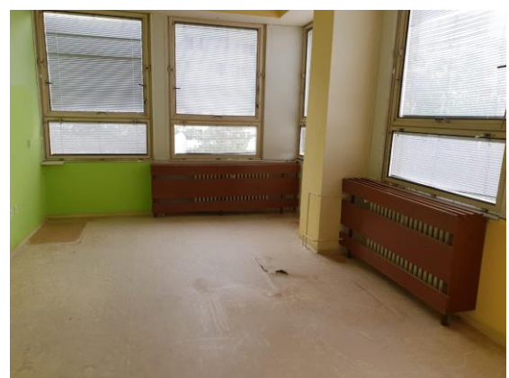
m. č. 316