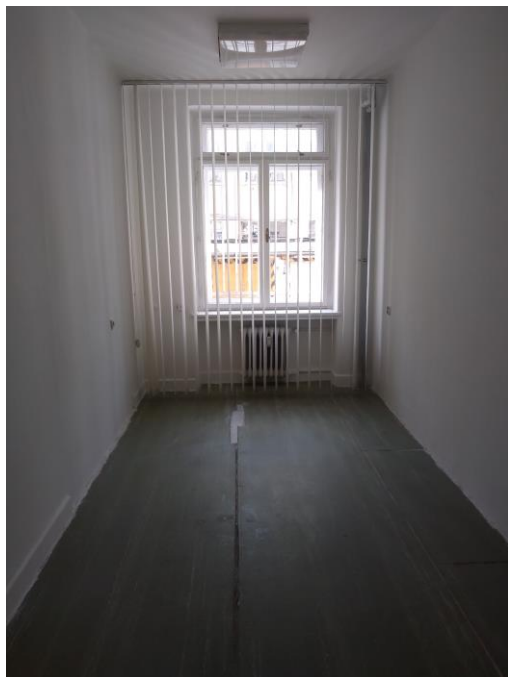
m. č. 007

obhliadky: Zuzana SPIŠÁKOVÁ tel. č. 0915 697 585