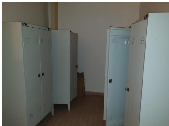
m. č. 243