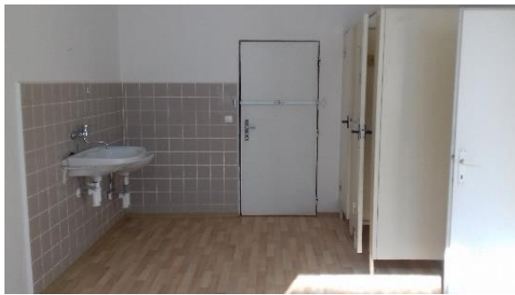
m. č. 247, 248, 246