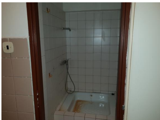
m. č. 244