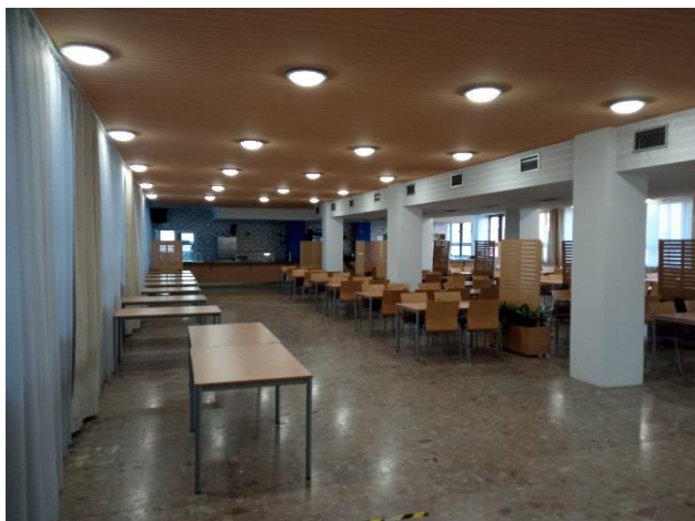
Prízemie, trakt G: jedáleň