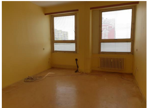
m. č. 245