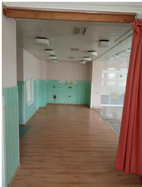
m. č. 71, trakt E