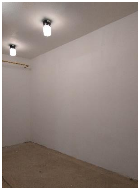
sklad, suterén m. č. 044