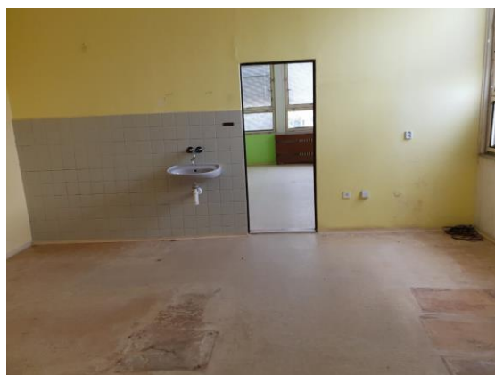
m. č. 315