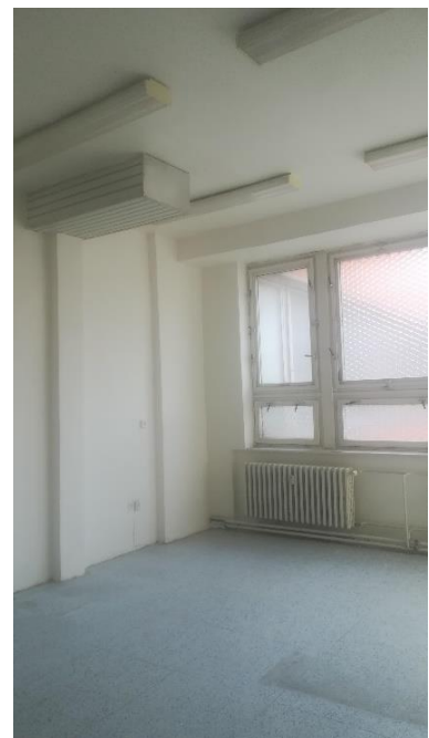
m.č.. 179, 180