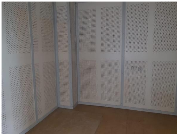
m. č. 321