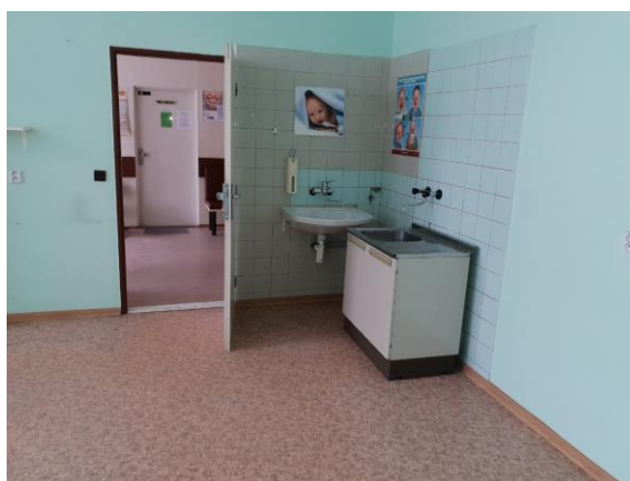
m. č. 321