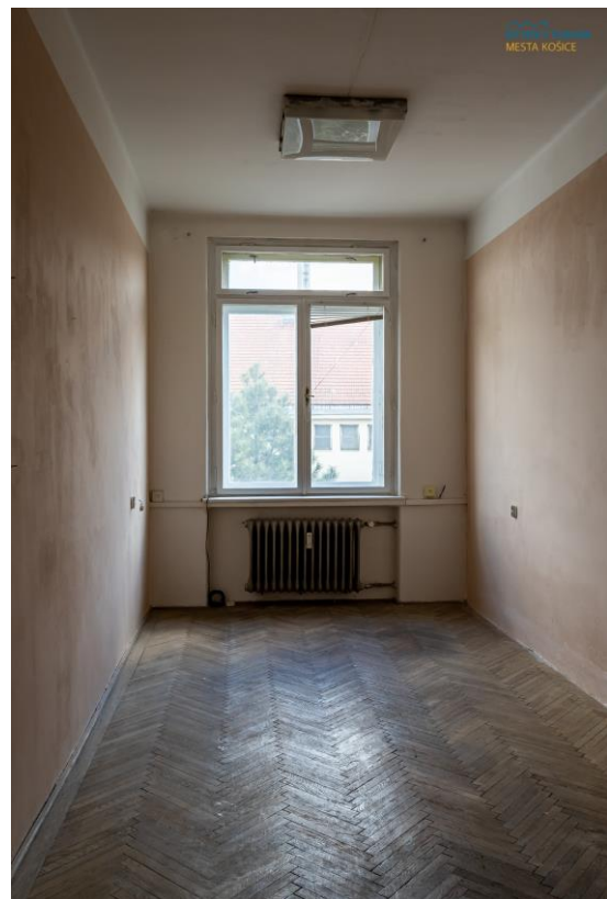
m. č. 323