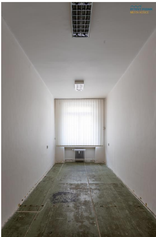
m. č. 006