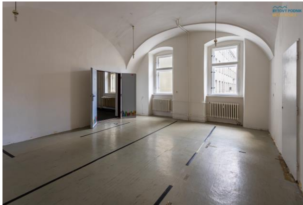
m. č. 118, 119