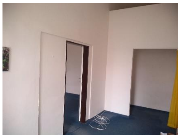
m. č. 213-215

j) priestory na ul. Tr. SNP 48/A v Košiciach (budova MMK)