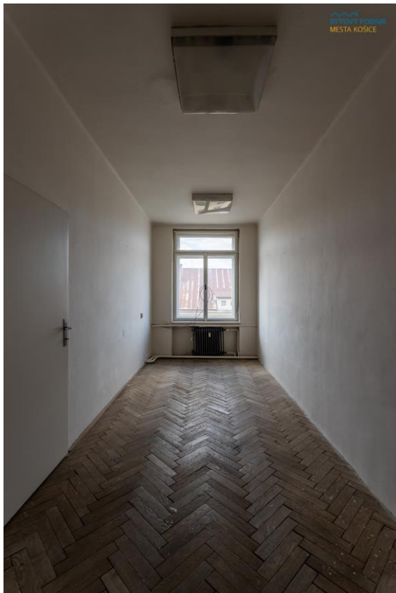
m. č. 407