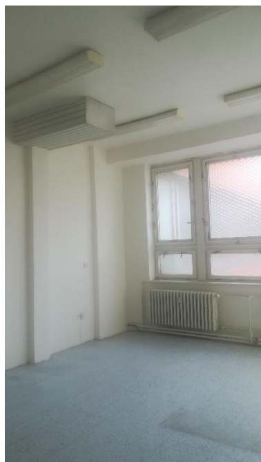
m.č.. 179, 180