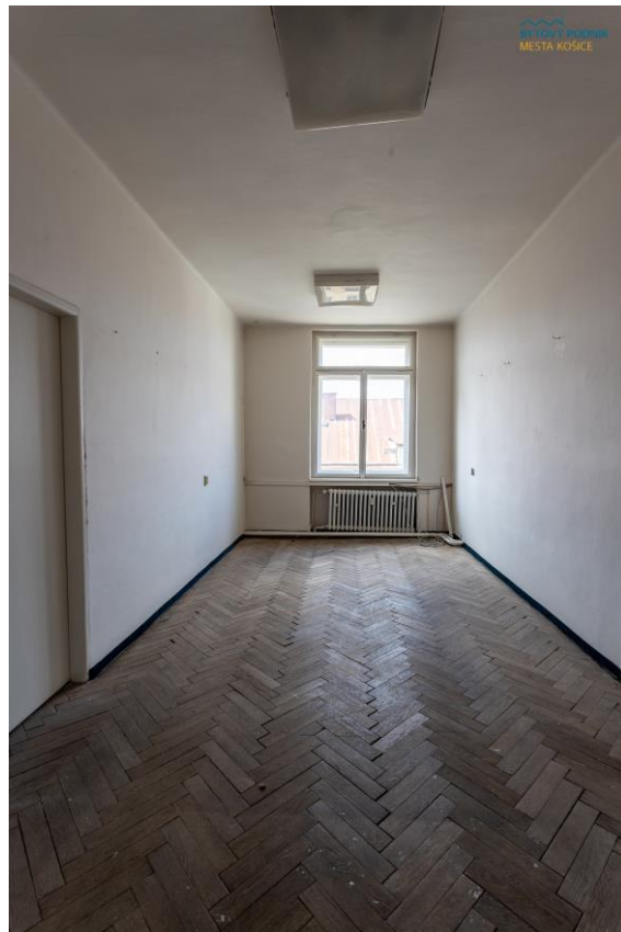
m. č. 408