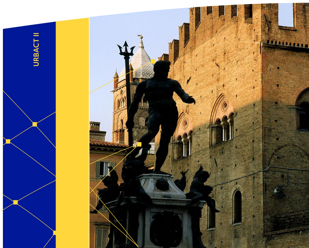
Bologna - Taliansko