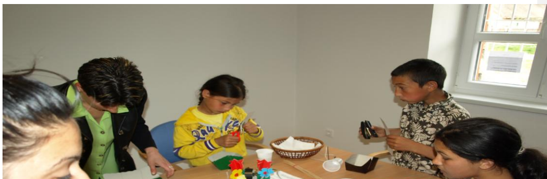
Nagykálló – Maďarsko