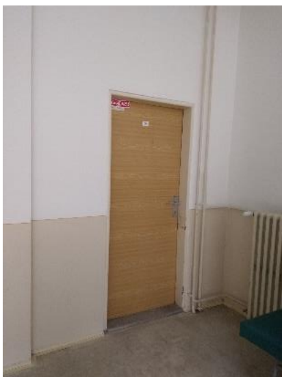
sklad, suterén m. č. 044