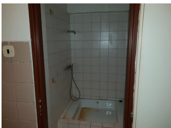
m. č. 244