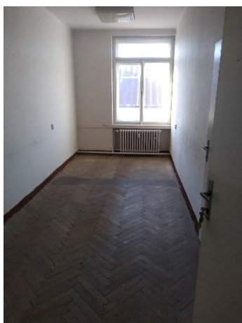
m. č. 411