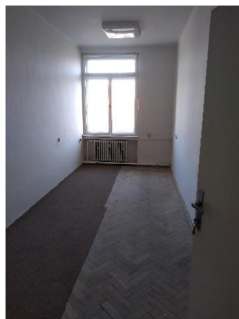
m. č. 421

h) priestory na ul. Hlavná 68 v Košiciach