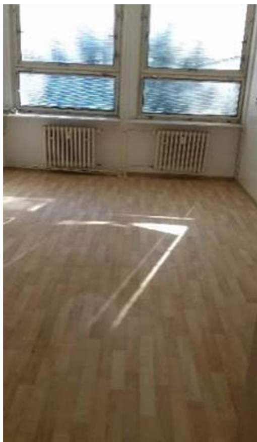
m. č. 239,240, servisný priestor