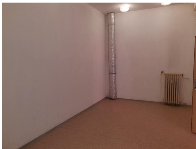
m. č. 277

f) priestor na ul. Americká tr. 17 v Košiciach Zdravotné stredisko Ťahanovce – parkovacie miesto vo dvore objektu