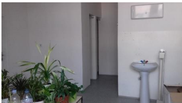
m. č. 246, 247, 248, 240