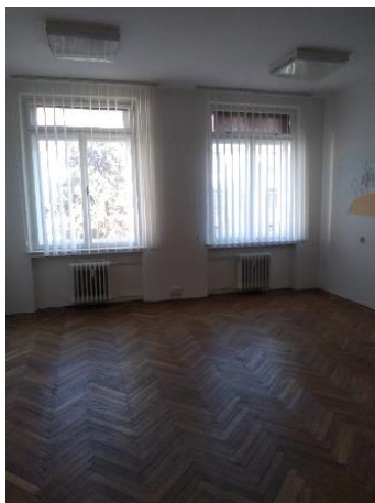
m. č. 220