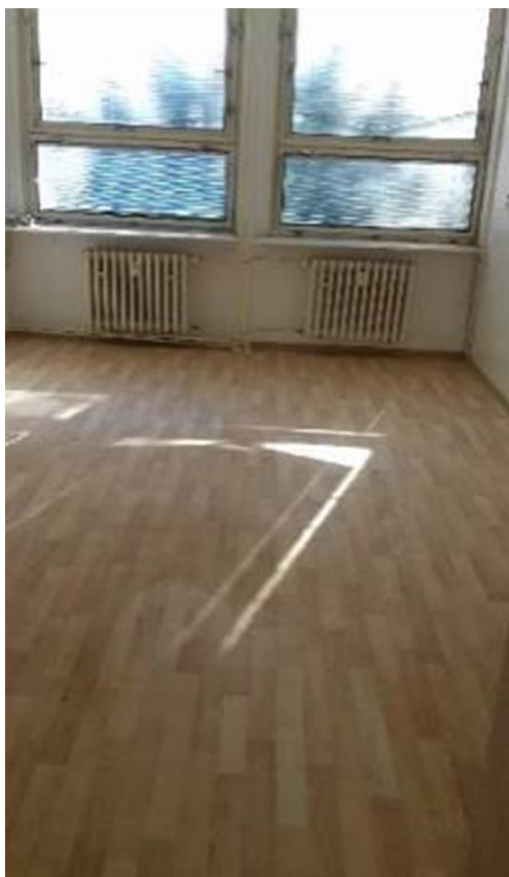
m. č. 239,240, servisný priestor