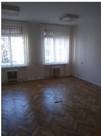
m. č. 219