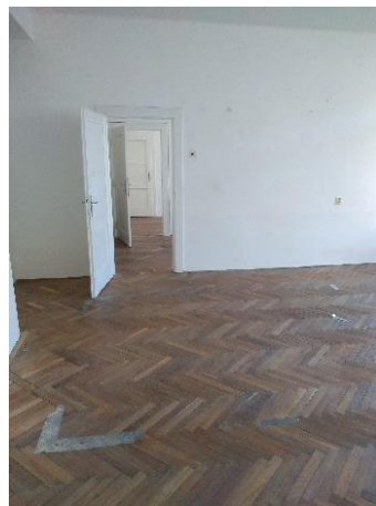
m. č. 221-223