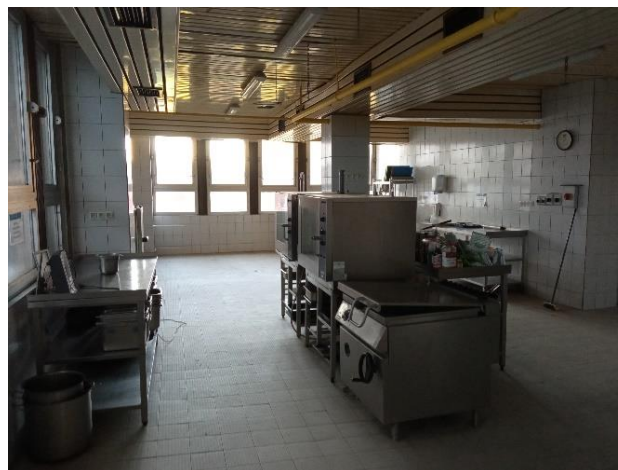
Prízemie, trakt G: jedáleň