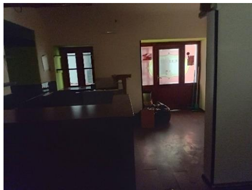
m.č. 0.04, 0.08 a časť 0.05