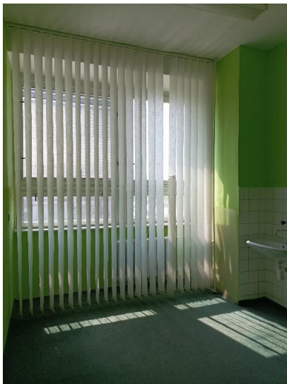
m. č. 145