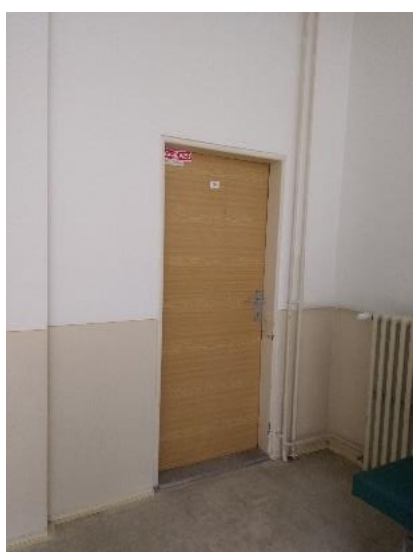
sklad, suterén m. č. 044