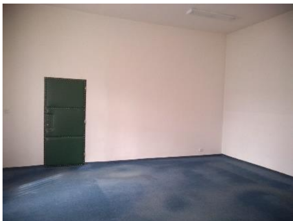
m. č. 213-215