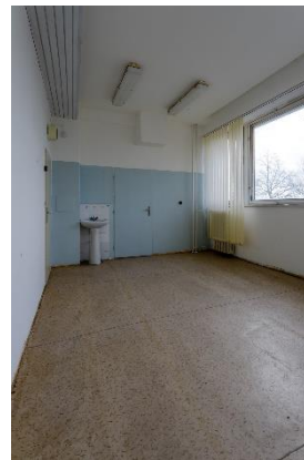
m.č. 0.36 – 0.41, 0.42