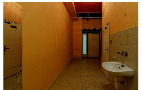
m. č. 243,244,245