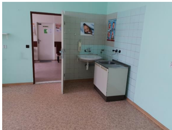
m. č. 321