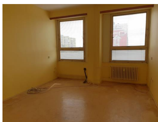
m. č. 245