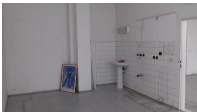
m. č. 179, 180