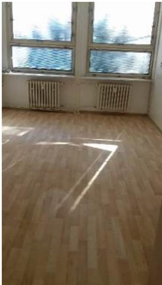
m. č. 239,240 servisný priestor