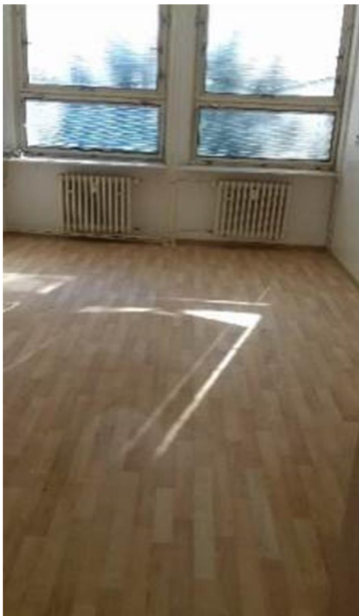
m. č. 239,240, servisný priestor