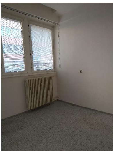
m. č. 014