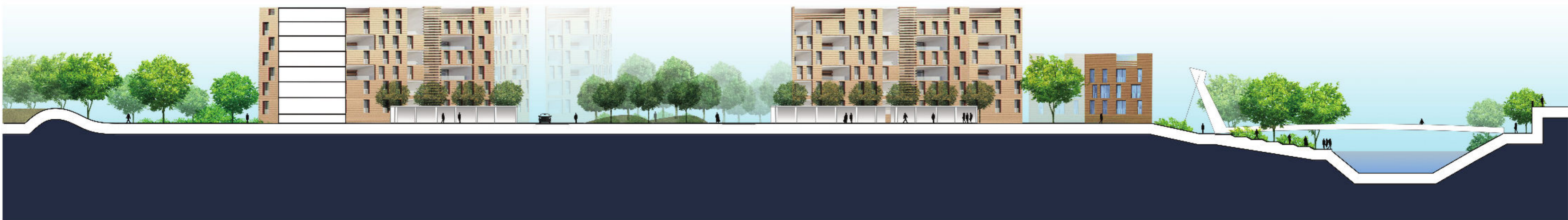
Vue vers la place centrale du quartier / Pohľad na hlavné námestie južnej štvrte