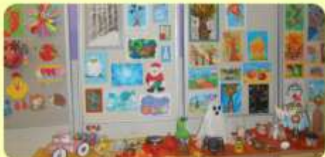
Výstava našich prác