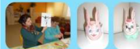
Spokojnosť z dobre vykonanej práce