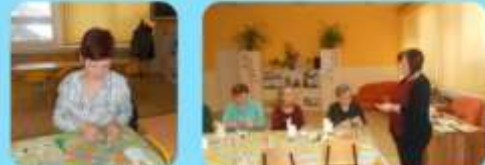
Začíname závesným kvetlnáčom