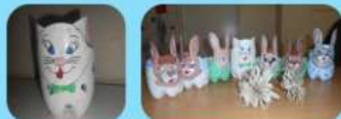
Hotové práce našich kolegýň