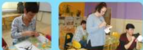
Dotváranie jednotlivé výrobky