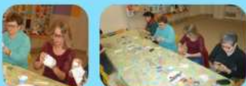
Začíname vytvárať kvietok