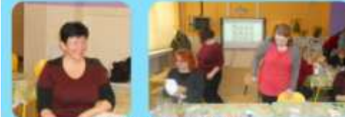
Tupovanie plastových fliaš