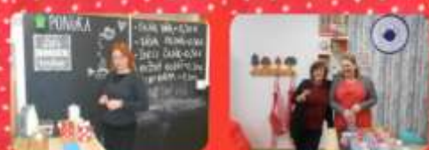
Občerstvenie v našej ČIAVIARNICKE