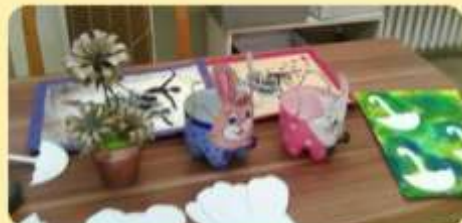
Ukážka a materiál k tvorbeniu výrobkov