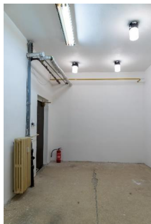
m. č. 1.02 bufet