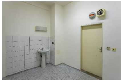
m. č. 0.29, 0.30