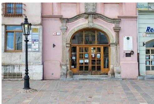
m.č. 004 a 005