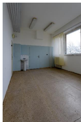
m.č. 0.36 – 0.41, 0.42