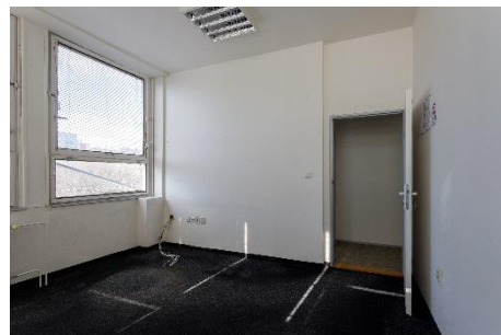
m. č. 362, 364