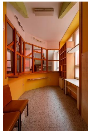
m. č. 129 – 143, 149