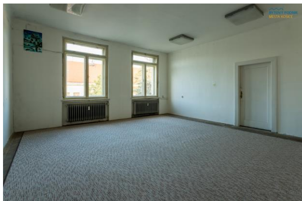
m.č. B 325