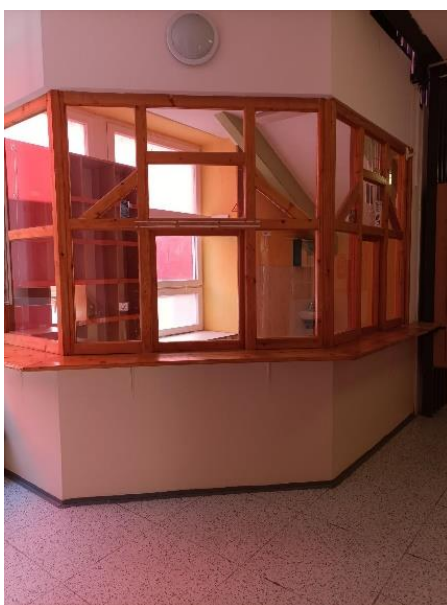
m.č. 1.02 Bufet pod schodami