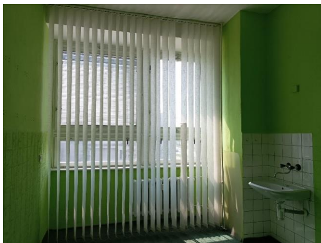
m. č. 145

h) priestor na ul. Americká tr. 17 v Košiciach Zdravotné stredisko Ťahanovce – parkovacie miesto vo dvore objektu