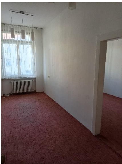
m. č. 213, 214