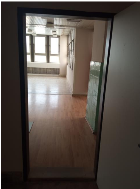
m. č. 71, trakt E