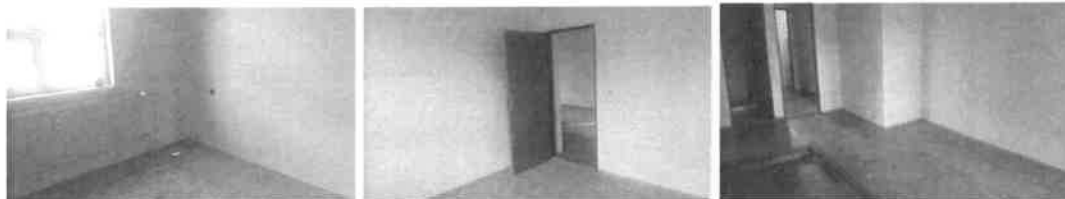
objekty Čárskeho 7