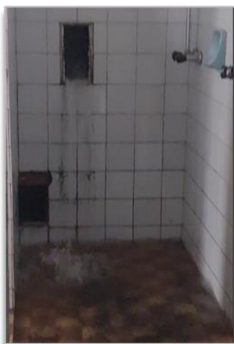
Obrázok 9 -11 Havarijný stav – vytopenie zázemia telocvične

Počas výkonu kontroly došlo k havarijnému stavu pravdepodobne dažďového zvodu zrekonštruovanej telocvične, pričom dažďová voda zaplavila priestory šatní pri telocvični (pozri fotodokumentáciu).