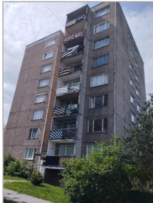
Obrázky 1 – 6

Súčasný nevyhovujúci stav bytového domu a vybraných bytových jednotiek je zobrazený v nasledujúcej fotodokumentácii.