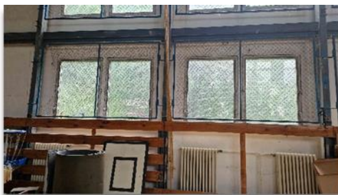
Obrázok 7 – 8 Malá telocvičňa

V decembri 2017 bola realizovaná oprava strechy nad celým telovýchovným zariadením z príspevku Ministerstva školstva Slovenskej republiky. Začiatkom roka 2019 bola dokončená rekonštrukcia veľkej telocvične - palubovka (projekt Ministerstvo školstva Slovenskej republiky), kúrenie a obvodový plášť (mesto Košice). Malá telocvičňa však bola v čase kontroly stále uzatvorená, v pôvodnom stave (pozri fotodokumentáciu).