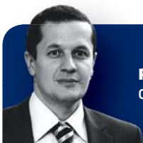
PETER MALÍK CEO, Erste Group Immopark SK

FLEXIBILNÝ PRIESTOROVÝ KONCEPT FLEXIBLE SPATIAL CONCEPT