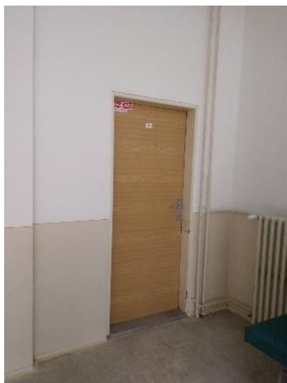
sklad, suterén m. č. 044