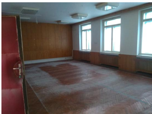
m. č. 119