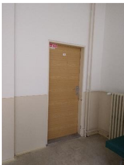
sklad, suterén m. č. 044