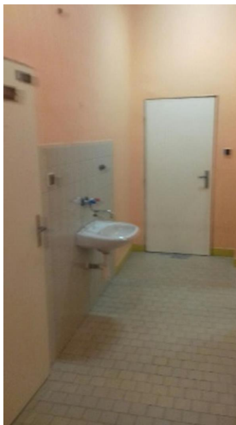
m. č. 239,240, servisný priestor