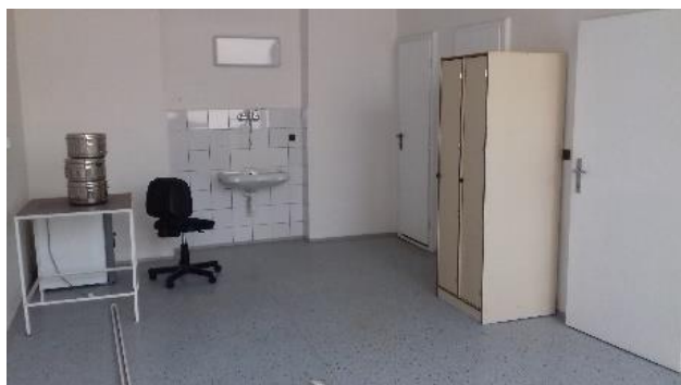
m. č. 246, 247, 248, 240