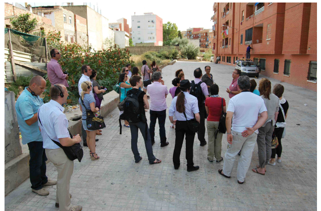
Členovia programu Roma-NeT na návšteve rómskych obydľí v Torrente

Pracujeme aj so staršou rómskou mládežou, ktorá navštevuje miestne stredné školy. V tejto skupine sa zaoberáme individuálnymi sociálnymi prípadmi, no uplatňujeme aj ďalekosiahlejšie prístupy, ktoré zohľadňujú potreby starších a potenciálne roztrpčených mladých Rómov. Takáto práca zahŕňa