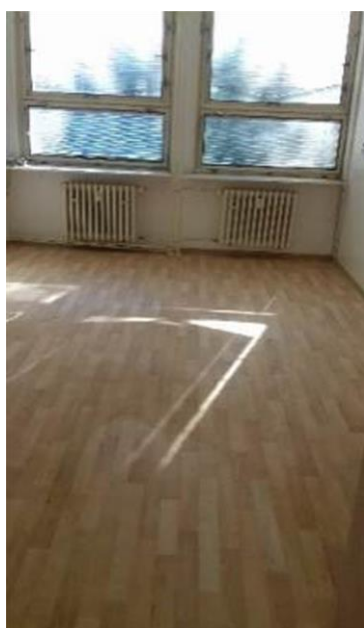
m. č. 239,240, servisný priestor