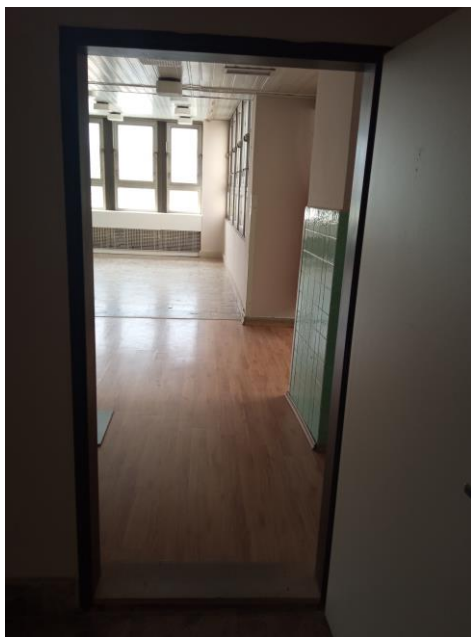
m. č. 71, trakt E