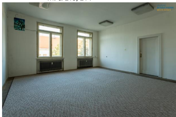
m.č. B 325