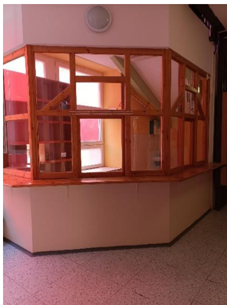
m.č. 1.02 Bufet pod schodami