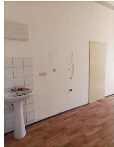
m .č. 252