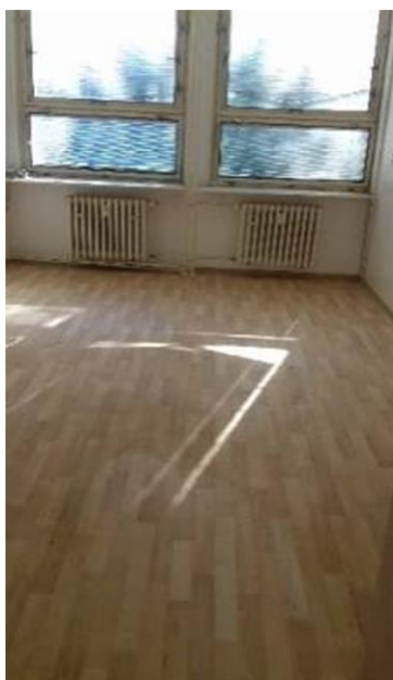
m. č. 239,240, servisný priestor