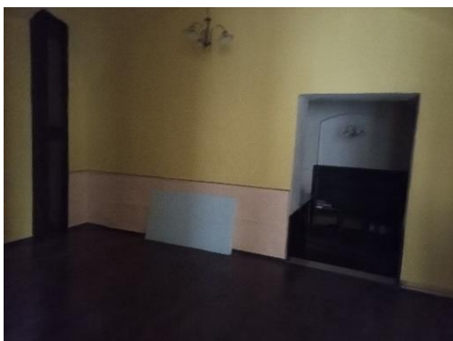
m.č. 0.04, 0.08 a časť 0.05

obhliadky: Zuzana SPIŠÁKOVÁ tel. č. 0915 697 585