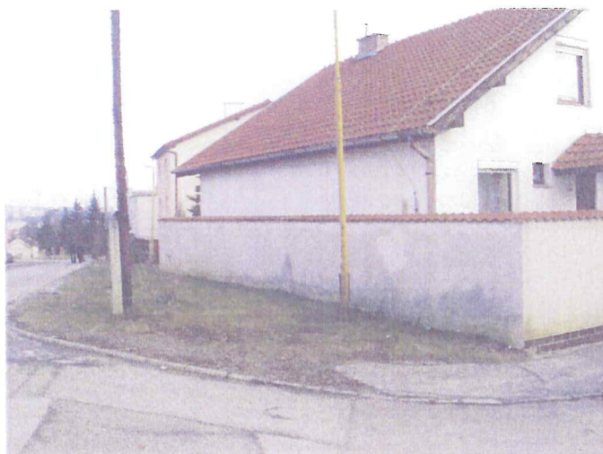
Pohľad na odčleňovanú časť pozemku z parcely č.999/8 , ul. Kostolná 21 Košice I- Sever , katastrálne územie SEVERNÉ MESTO