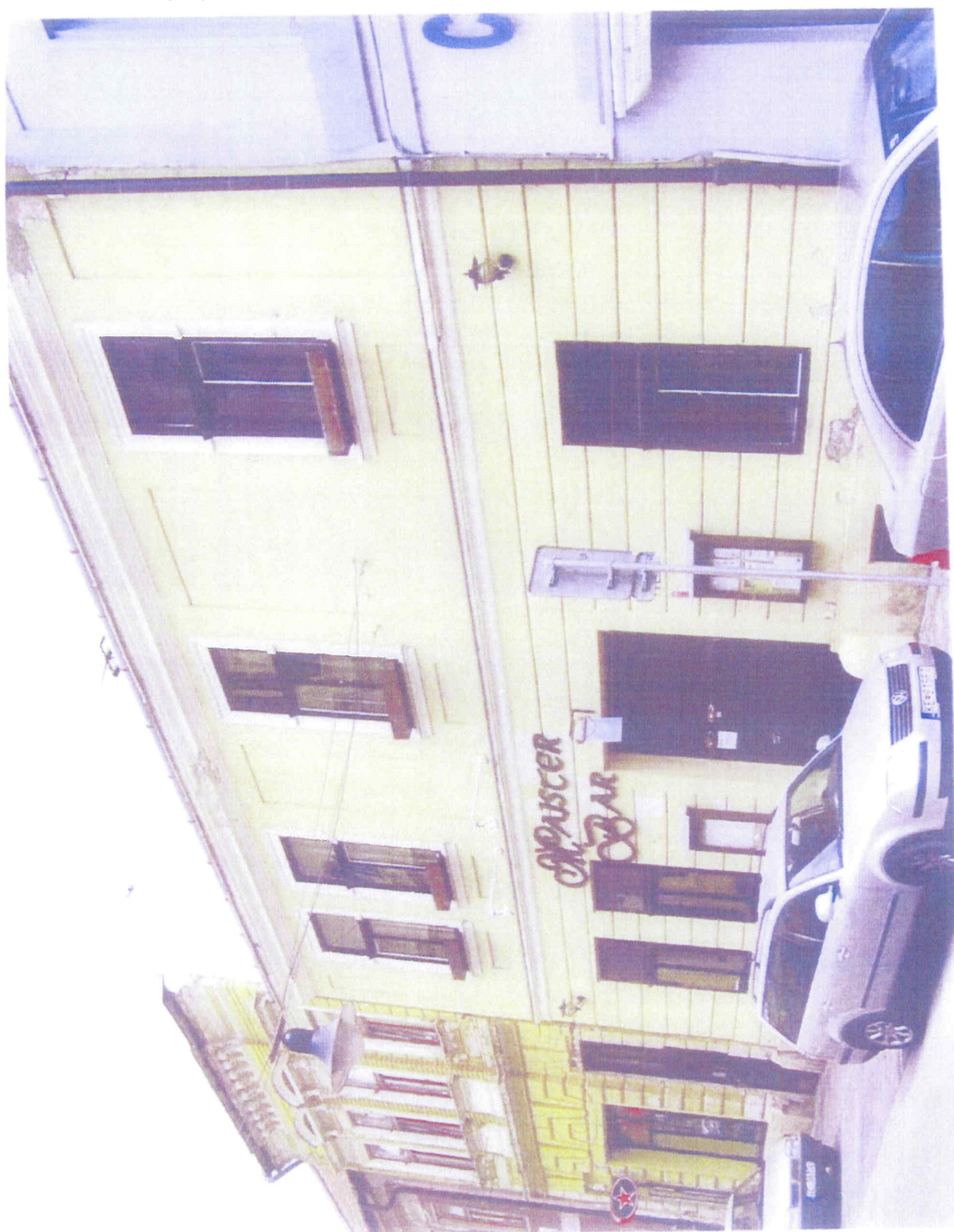
Pohľad na obytný dom Kovačska 11