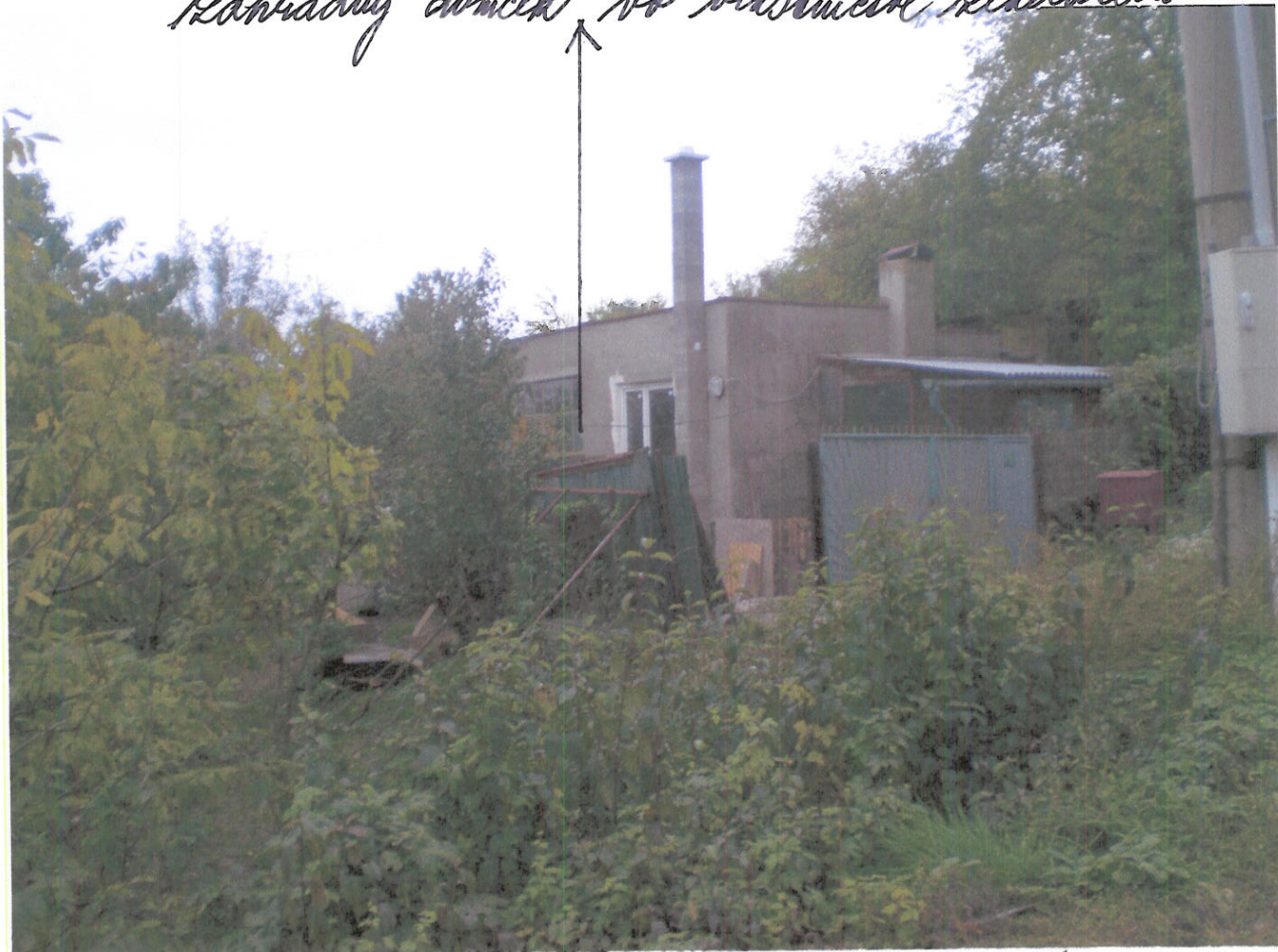
pokemok vo vlastničve mesta Košice