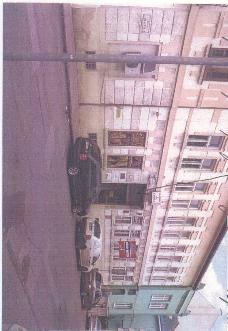
dobrána pre Bratislavu a prístup