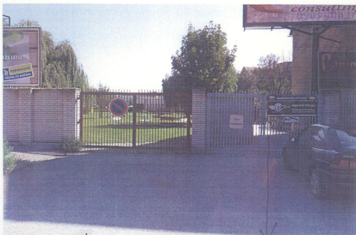
prístupová komunikácia - pr. č. 2014/6 k rozvodu Bratislavského ulice