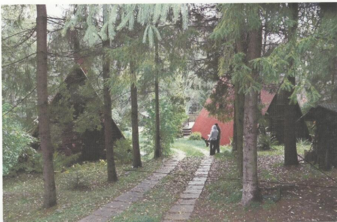
pozemok časť parc. KN-EE. 169/1 vo vlastníctve m. Kónice