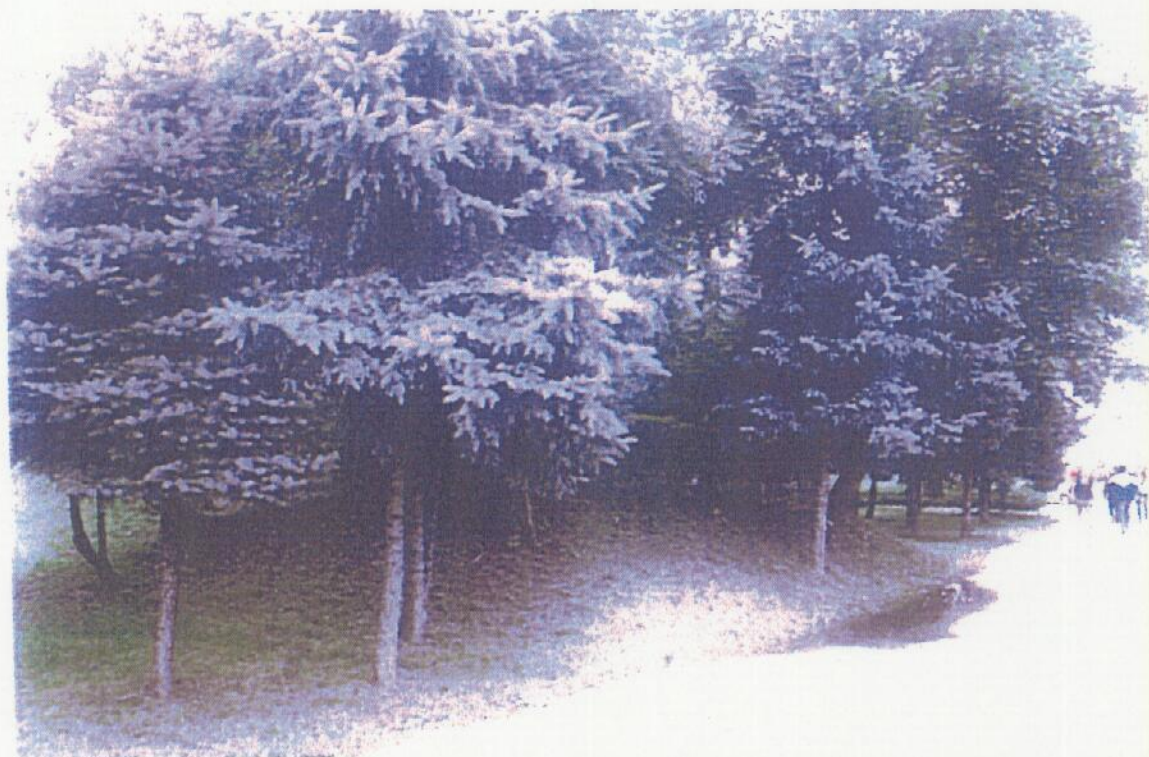
Pohľad na parc. č. 2030/1