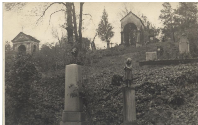
cca pol. 20. storočia

Evanjelický cintorín na historických obrazových zobrazeniach