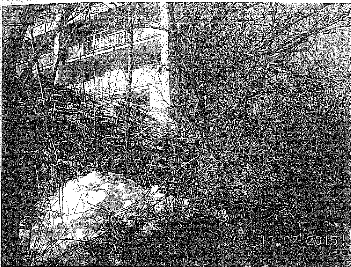
Pohľad na parcelu z južnej strany z parcely č. 7132/3

Pozemok, novovytvorená parc.č. 7132/262 v k.ú. Severné Mesto, obec Košice