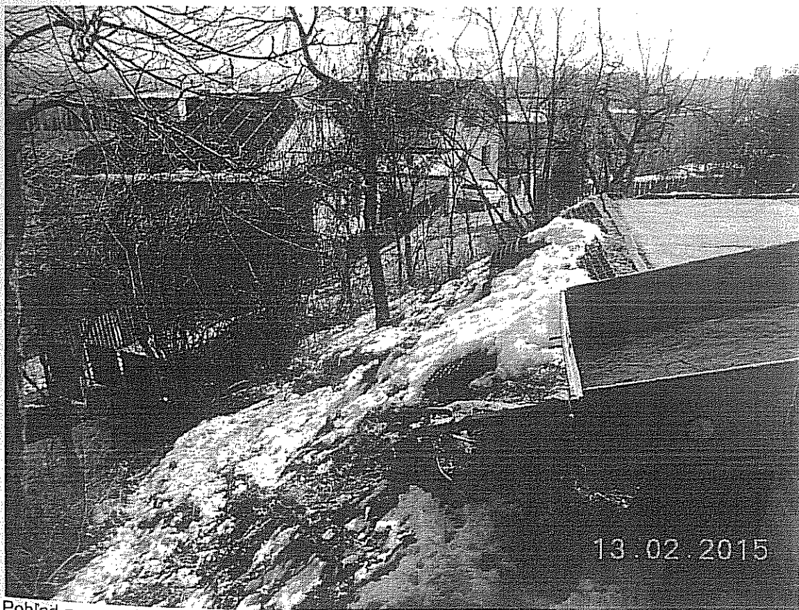
Pohľad na parcelu z rohu bytového domu na parc. 7096