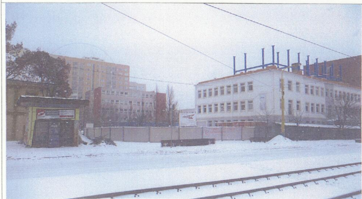
Pohl'ad od ulice Južná trieda v smere na ulicu Ludmanská

Fotodokumentácia - pozemok parc. č. 2495/3, 2503/1, 2628/15, kat. úz. Skladná, okres Košice IV, vyhotovené 30.1.2010