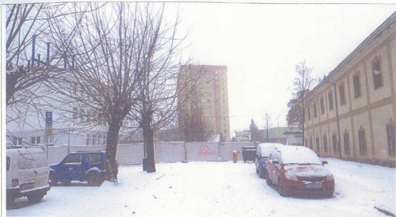
Pohl'ad od ulice Ludmanská v smere na ulicu Južná trieda