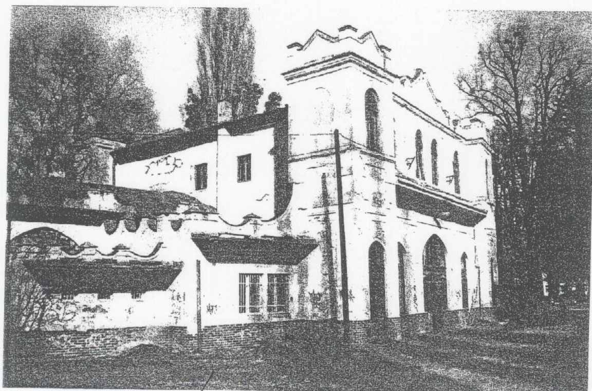
↓ pare. č. 2056/1