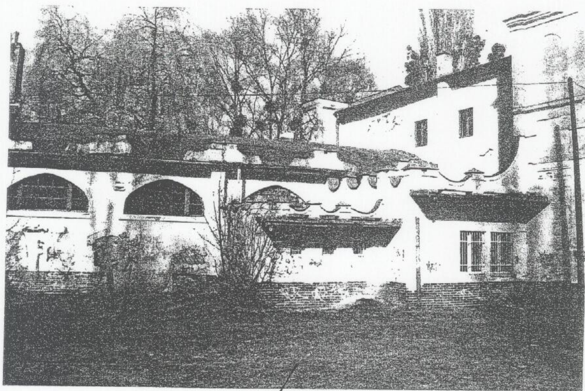
↓ pare. č. 2056/1 (2056/15)