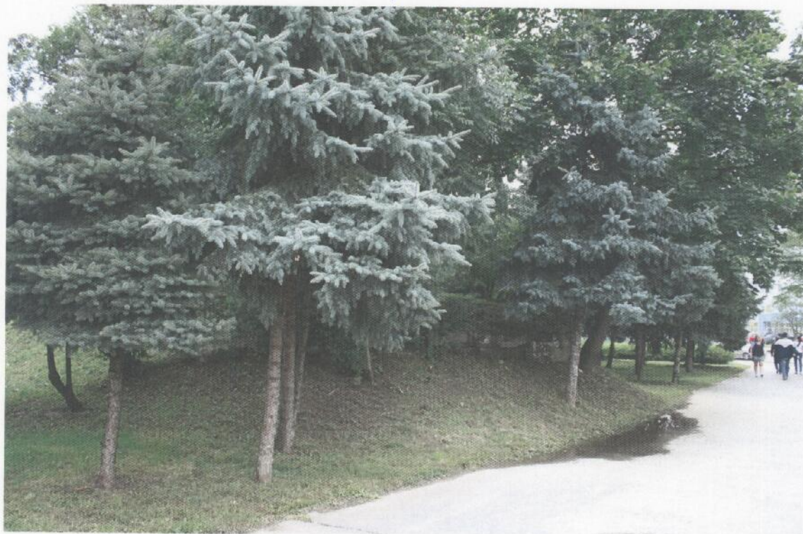
Pohľad na parc. č. 2030/1