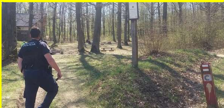
Kontroly rekreačných lokalít