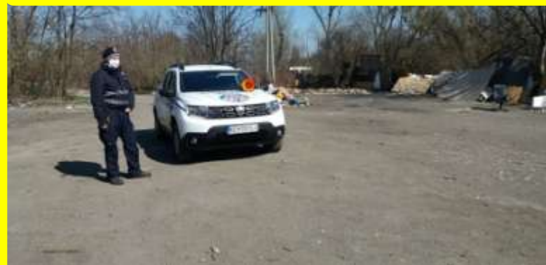
Kontroly v nelegálnych osadách