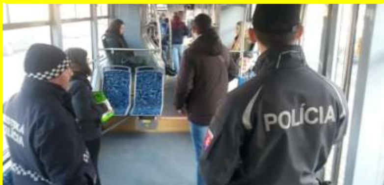
Spoločné kontroly vo vozidlách MHD