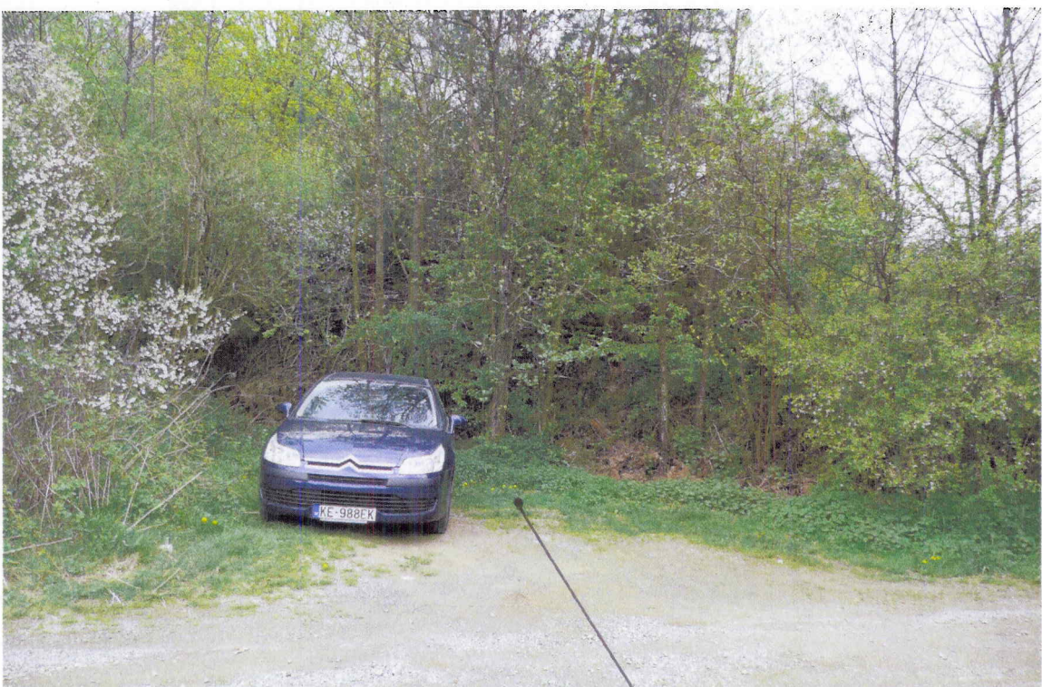
PARC. Č. 1771/2 VO VLASTNICTVE MESTA KOŠICE (374 m 2 )