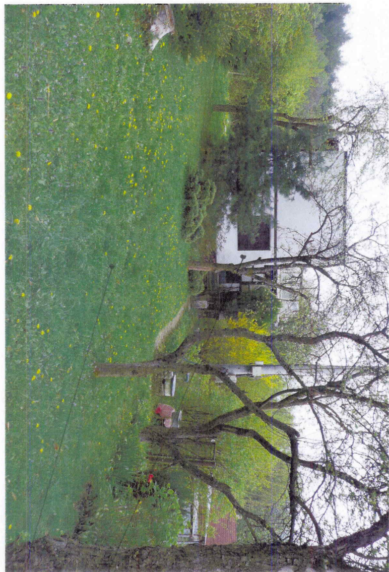
CHATA BEZ S.Č. NO VLASTNÍCTVE MUDR. IVANČA POZEMOK POD CHATOU PARC. Č. 634 NO VLASTNÍCTVE MESTA KOŠICE (36 m 2 ) POZEMOK PARC. Č. 638 - VL. MPE (449 m 2 )