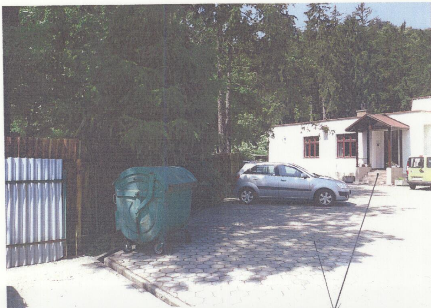
dom a pozemok vo vlastníctve Lubyorcon