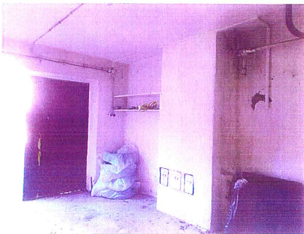
Pohľad na komín a rozvody médií s uzávermi.