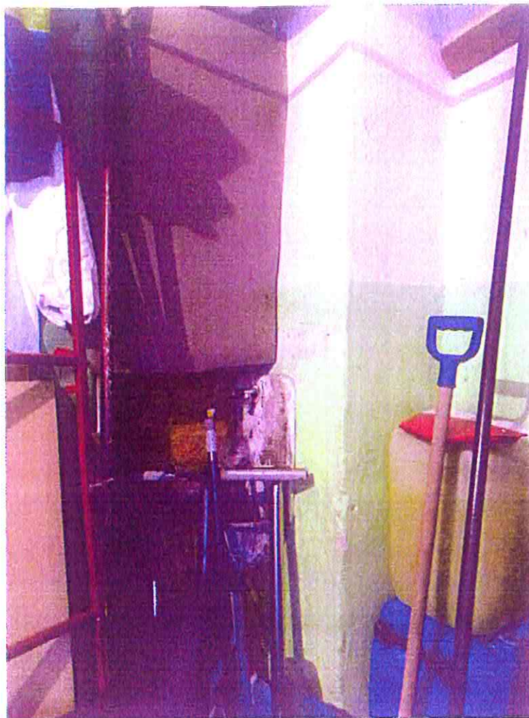
Staršie umývadlo, umiestnené v dieliacej stene, vývod vody je do tohto novovytvoreného priestoru č. 1.