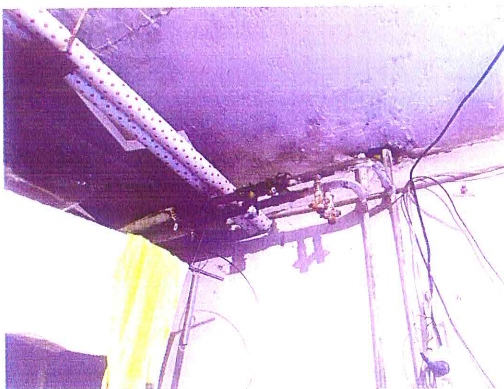
Rozvody médií s uzávermi, pod stropom