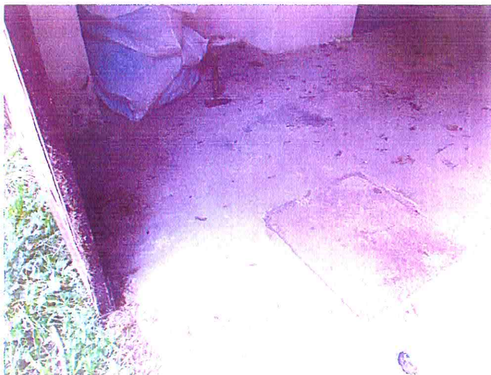
Poklop šachty, umiestnený v podlahe priestoru. Navlhnuté omietky v styku s podlahou