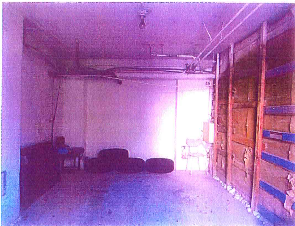
Pohľad na interiér priestoru - rozvody médií pod stropom, s uzávermi. Vpravo drevená deliaca konštrukcia.