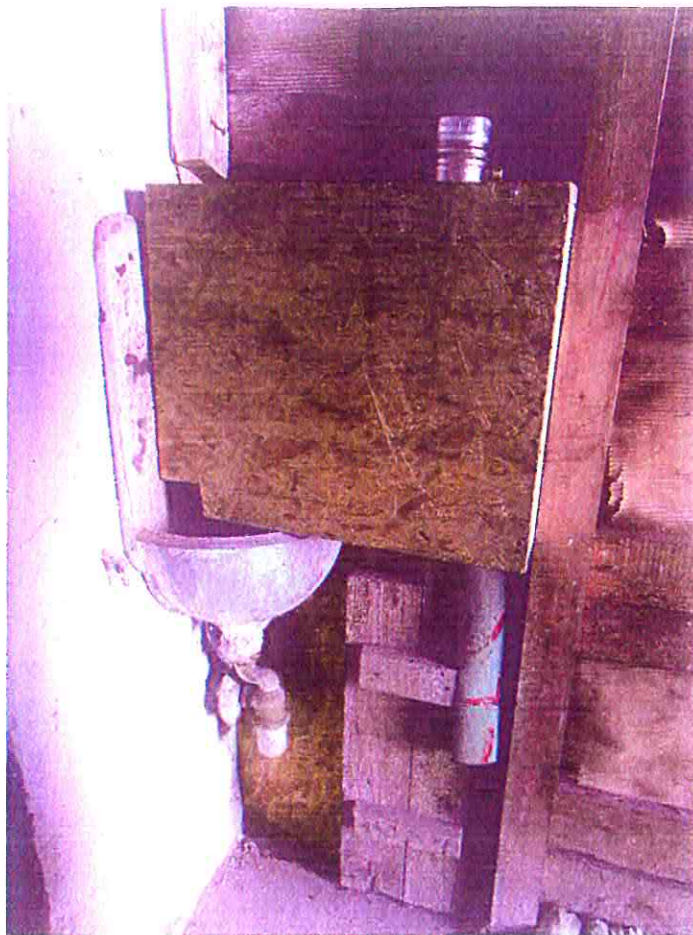
Staršie umývadlo, umiestnené v dieliacej stene, vývod vody je do susedného novovytvoreného priestoru č. 2.