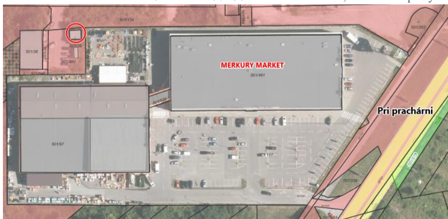
Obrázok 9 Parcela č. 501/38 vo vlastníctve mesta, zverená do správy ZŠ