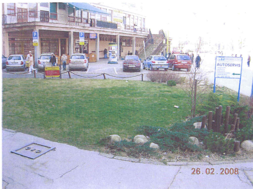
Jestvujúci stav-povodný pozemok p.č. 2677/7