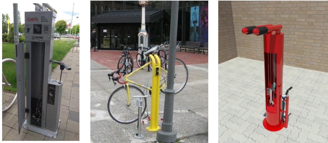
Obr. 6 Príklad servisného stojana

Predpokladaný počet servisných stojanov 5 v celkovej hodnote 7 000 EUR s DPH.