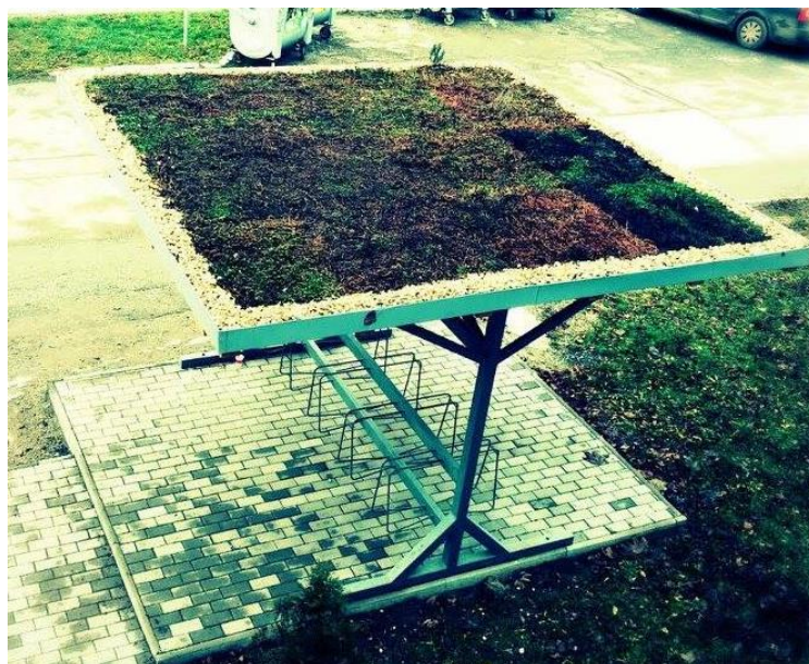
Obr. 3, 4 a 5 Príklad cyklistického prístrešku a zrealizovanej extenzívnej vegetačnej strechy (napr. v areáli TUKE)