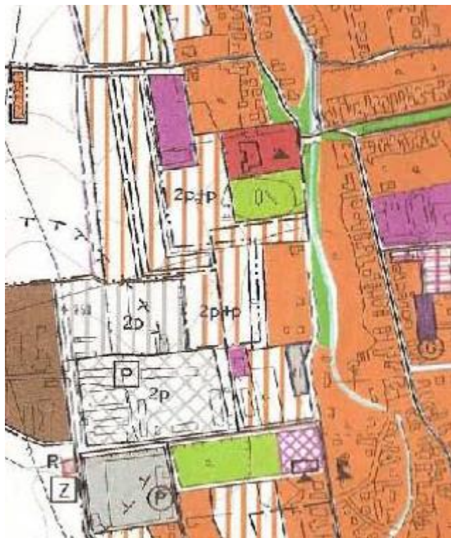
J. Funkčné a priestorové regulatívy lokalít