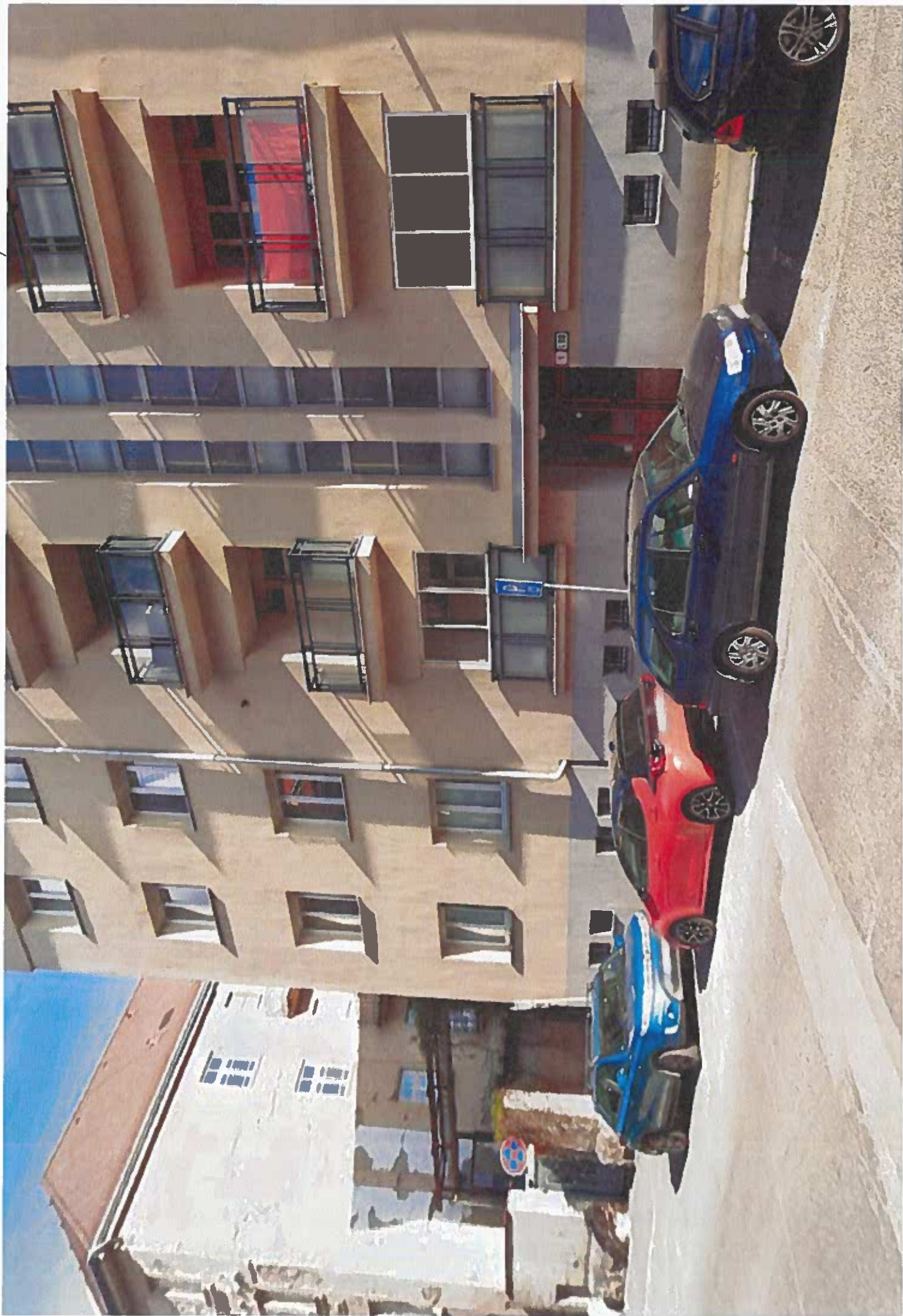
БЫТОВЫ ДОМ ПОДТАТРАНСКЕГО 7