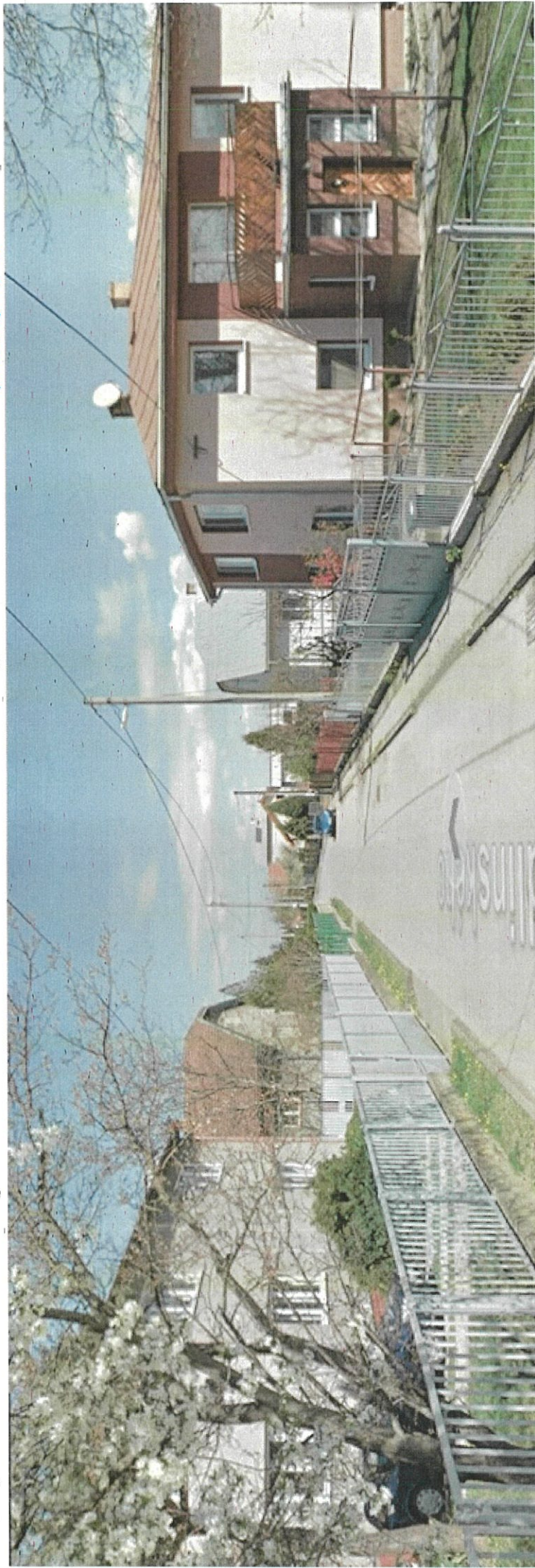
Príloha č. 3